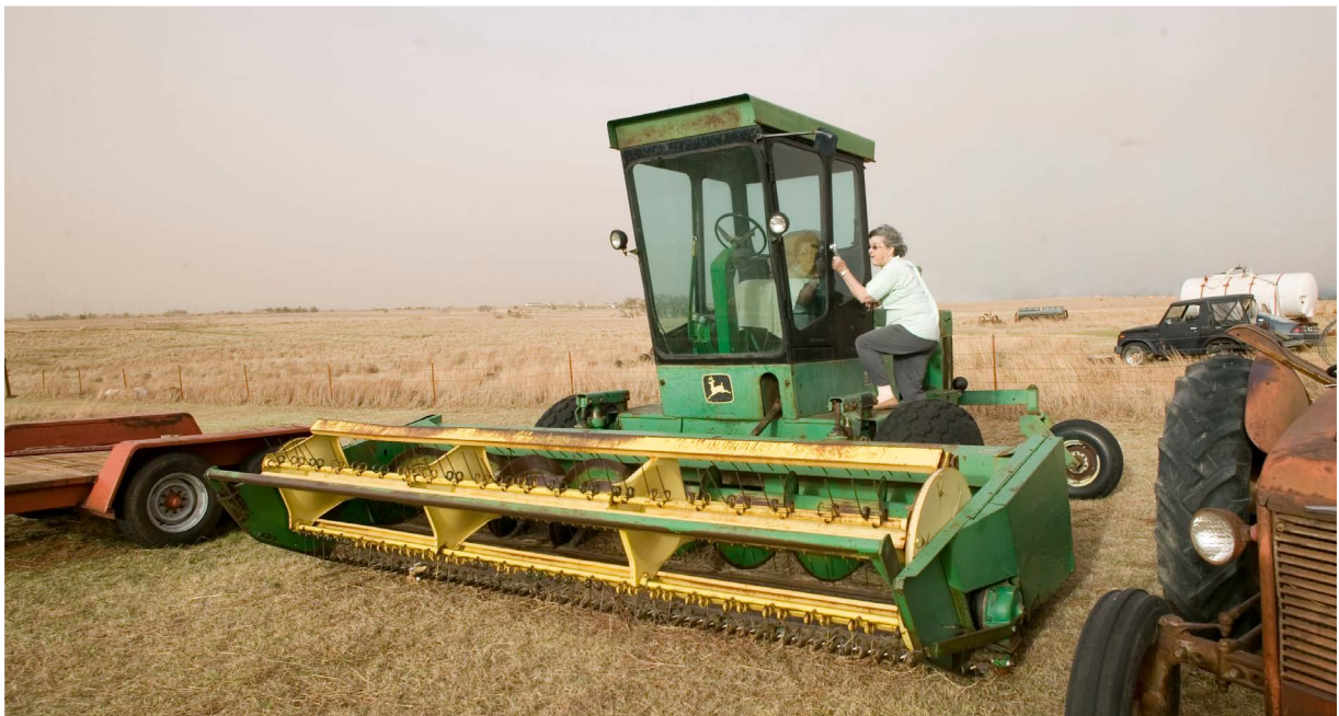
Figura 9. Almacene o estacione su maquinaria mínimo a 20 pies de otros vehículos y construcciones, y hágalo en sitios con grava o suelo desnudo si es posible. Reduzca el combustible o vegetación alrededor y bajo la maquinaria con cortadoras de césped, desbrozado o pastoreo.