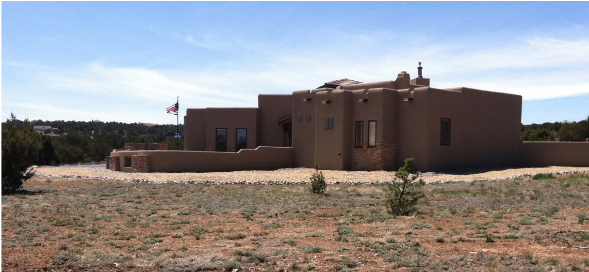
Figura 5. Considere usar mantillo no combustible, como piedra triturada o grava, alrededor de casas o edificios, y aleje todos los materiales inflamables de las paredes exteriores, incluidos hojarasca, árboles y arbustos inflamables, hojas, pilas de leña, pilas de madera y otros elementos combustibles. Esta foto muestra un buen ejemplo de cómo preparar las zonas inmediatas (hasta 5 pies) e intermedias (5 a 30 pies) alrededor de una casa.