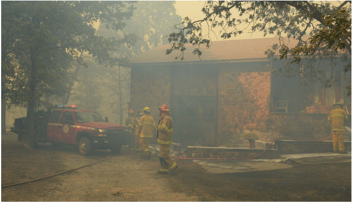
Figura 4. La zona inmediata, el área dentro de los 5 pies de la casa, granero o edificio es la zona más importante. Completa esta zona primero.