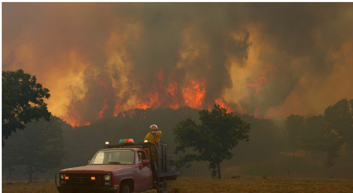
Figura 1. El momento de pensar en proteger casas, graneros, artículos personales y terrenos no es cuando se acerca el fuego, sino mucho antes de que se vea o huelva el humo.

Los incendios salvajes pueden ocurrir en cualquier época del año; sin embargo, la mayoría ocurre durante la temporada de inactividad o durante los períodos de sequía cuando los combustibles (vegetación) están secos. Las condiciones del combustible, la cantidad de combustible, la disposición del combustible, la topografía y las condiciones climáticas afectan la severidad de los incendios salvajes. De estos factores, la cantidad y disposición del combustible alrededor de las casas e infraestructura se pueden cambiar o mitigar. No existen garantías cuando se enfrenta a un incendio y no todos los métodos enumerados en este documento pueden o protegerán completamente su granja o rancho de cada escenario de incendio. Sin embargo, estar preparado aumentará las probabilidades de que usted, su familia y su propiedad sobrevivan a un incendio salvaje.