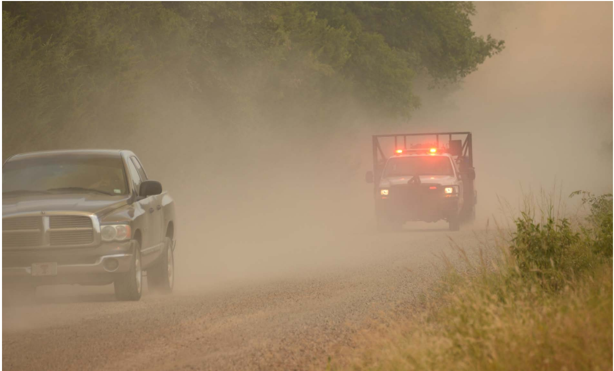
Figura 13. Si tiene que evacuar, salga lo antes posible. Dejar sin demora los caminos despejados para que los bomberos instalen el equipo para combatir el fuego. Encienda las luces delanteras cuando evacúe y conduzca en el humo.