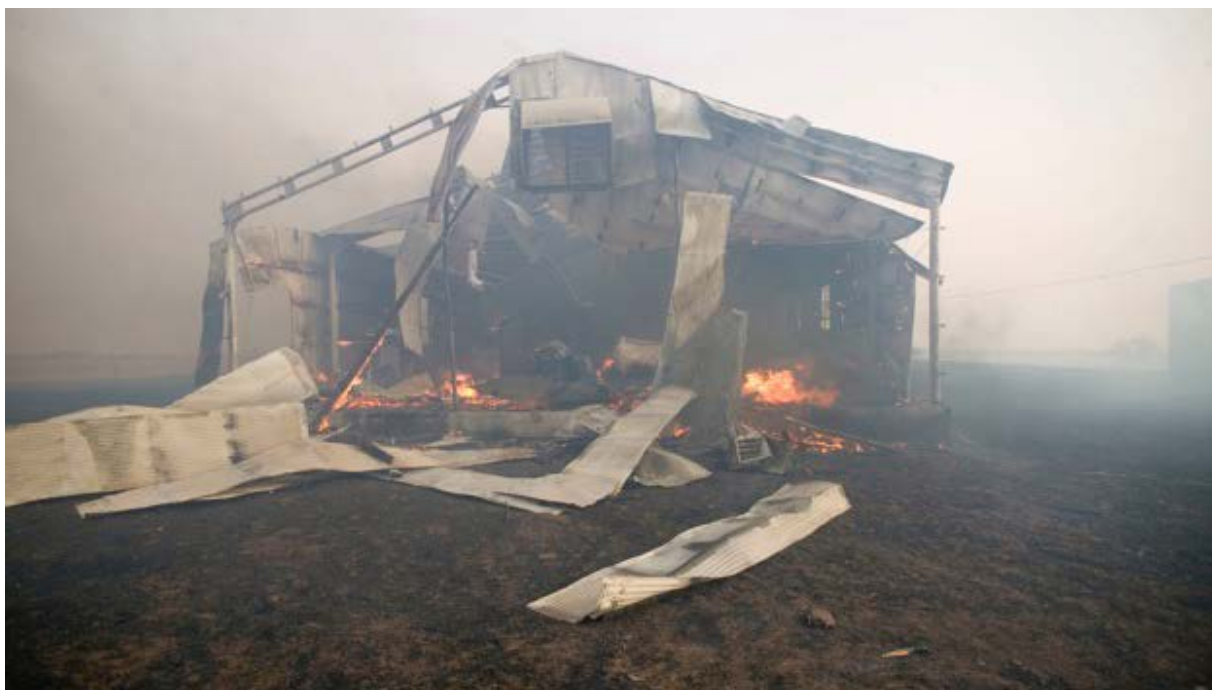
Figura 2. A pesar de los mejores preparativos, los resultados indeseables aún son posibles. Uno de los primeros pasos es llamar o programar una reunión con su agente de seguros para una revisión de la póliza y garantizar la cobertura deseada y adecuada.

Firewise.org denomina al área de preocupación alrededor de las casas y edificios la zona de ignición de la casa (Figura 1). Aunque estas recomendaciones se desarrollaron para casas, el mismo enfoque se puede aplicar a graneros, talleres y otras dependencias. Hay tres zonas principales de preocupación en torno a viviendas y edificios: inmediata, intermedia y extendida.