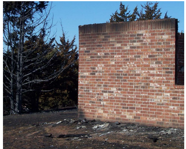
Figura 6. La preparación es clave antes de que un incendio forestal afecte su hogar, graneros y terrenos. Una pequeña cantidad de trabajo de preparación, como cortar el césped, podar árboles y limpiar, como se ilustra en la foto de arriba, hará que su propiedad sea más segura en caso de incendio, lo que le dará a su hogar y otros edificios una mejor probabilidad de no ser afectados.