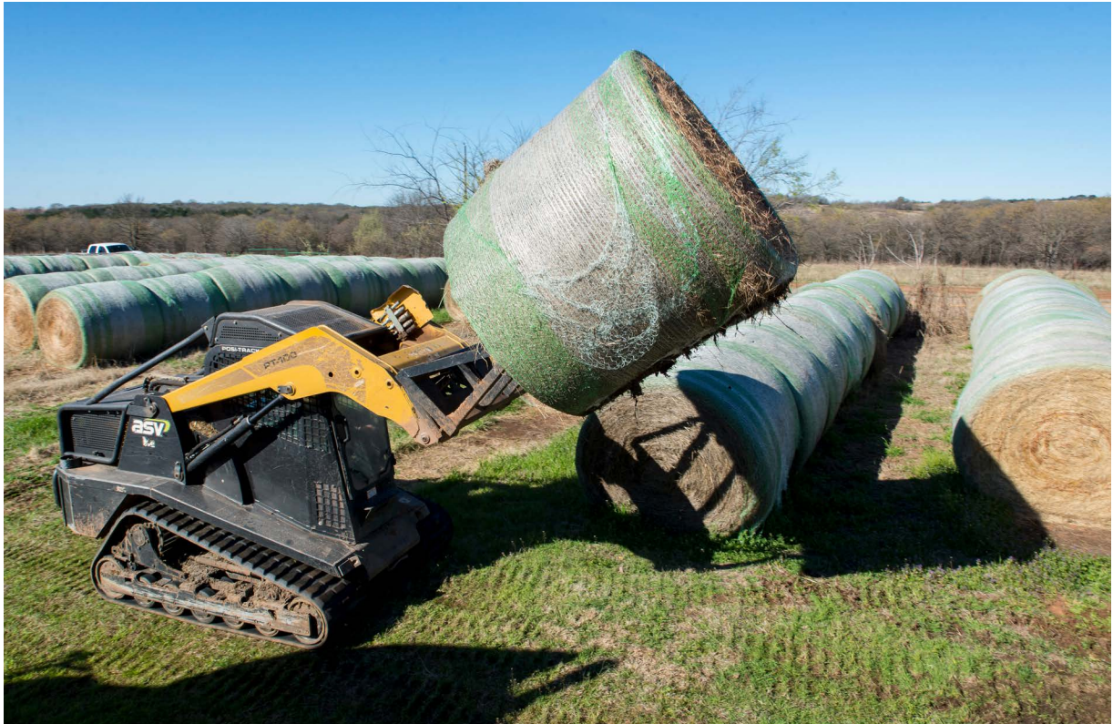
Figura 8. No almacene todo el heno en un solo sitio, reduzca las cargas de combustible alrededor del heno almacenado y manténgalo lejos de edificios, equipos u otros elementos que el calor radiante pueda dañar.