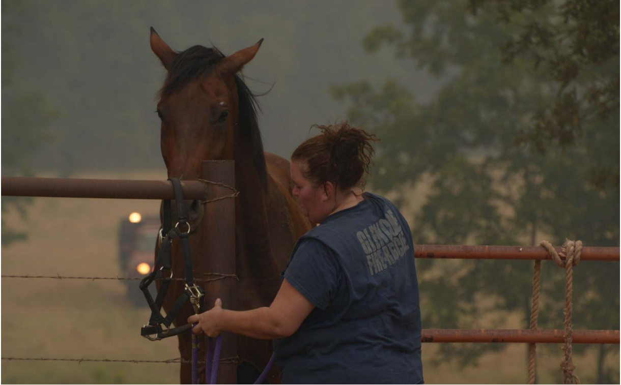
Figura 11. Tenga un plan de evacuación de ganado que considere cómo y dónde se llevará el ganado en caso de un incendio.