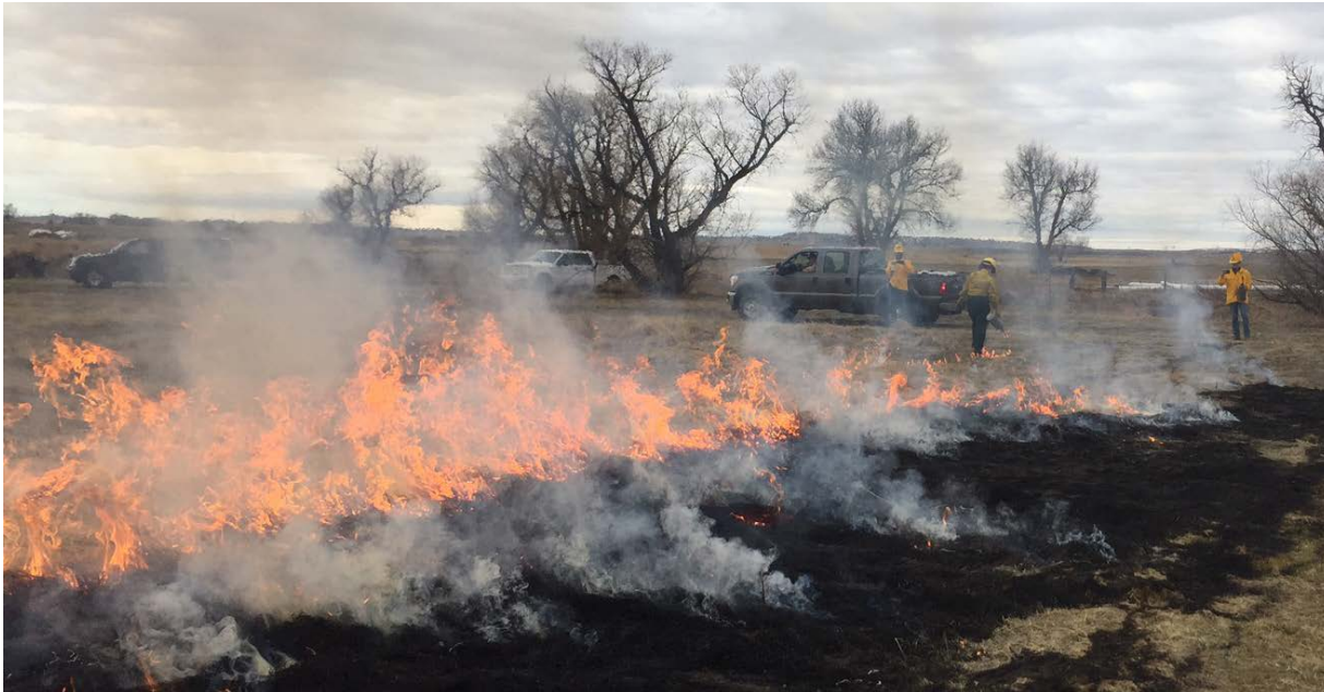
Figura 7. Cree un cortafuegos alrededor de la zona de ignición de la casa con un fuego prescrito antes de la temporada de incendios salvajes. Asegúrese de que la quema se produzca antes de que las condiciones se vuelvan demasiado secas o las prohibiciones de quema restrinjan la capacidad de quemar.