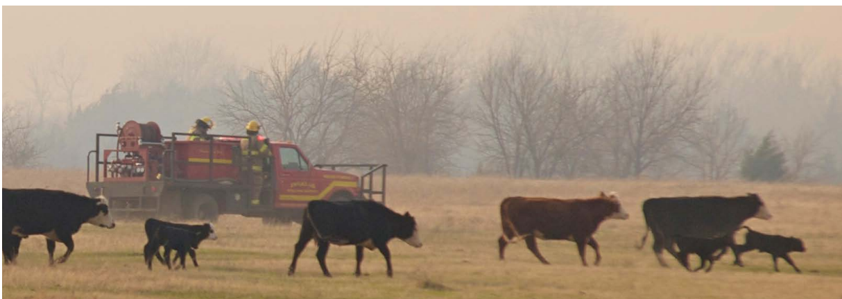
Figura 10. Cree áreas seguras para el ganado colocando sal y minerales o áreas de alimentación de invierno a lo largo de las cercas o en las esquinas de los pastizales. Recuerde, no intente arrear animales frente a un incendio, no vale la pena su vida.

En caso de que quede atrapado en un vehículo (automóvil, camión, tractor con cabina, otros equipos) con el fuego acercándose a usted, o su vehículo queda varado frente a un incendio, no intente salir y dejar atrás el fuego. Suba las ventanas y encienda el aire acondicionado para recircular el aire dentro del automóvil. Esto ayudará a minimizar el ingreso del humo dentro del vehículo. Trate de estacionar el automóvil en un área alejada de combustibles pesados, como arbustos y árboles. Si es posible, coloque un obstáculo entre usted y las llamas (p. ej., otro vehículo, edificio, pared de concreto) para protegerlo del calor radiante. Deje el motor en marcha y agáchese lo más posible de las ventanas para protegerse del calor radiante. Cúbrase la cara y la piel expuesta con tela seca. Trate de mantener la calma y no salga hasta que las llamas hayan pasado. Podrá respirar, aunque se pondrá caliente y humeante por un momento. Los neumáticos del vehículo pueden explotar debido al calor y posiblemente incendiarse, al igual que algunos de los cables y otros elementos de plástico. El vehículo no explotará. Permanezca en su vehículo hasta que el fuego pase. Si el vehículo es manejable, muévase; si no, salga y evalúe la situación.