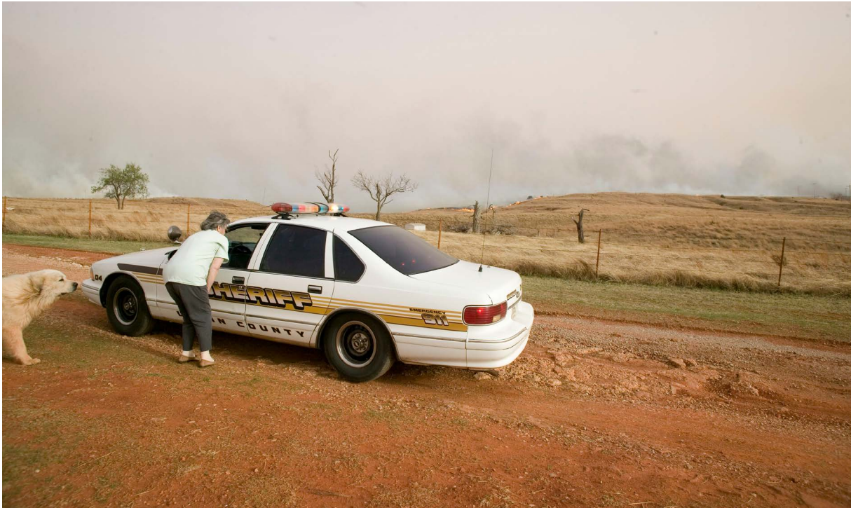
Figura 12. Sepa dónde encontrar las últimas noticias y actualizaciones de los medios de comunicación locales y el departamento de bomberos y consulte con frecuencia durante un evento de incendio. La situación puede cambiar rápidamente. Asegúrese de tener a la mano números de teléfono importantes: departamento de bomberos, alguacil del condado y vecinos.